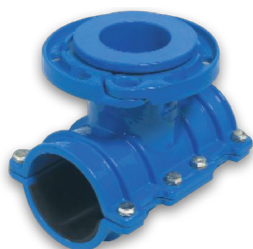
Версия на фланец DN 80-100